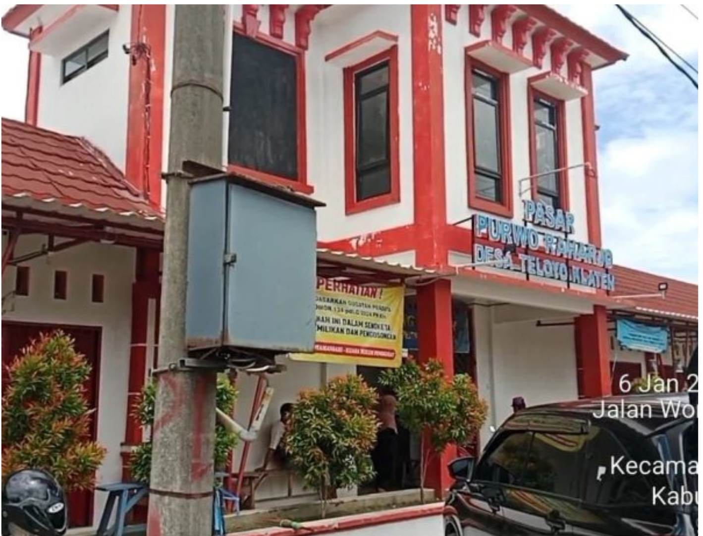
Foto: Pasar Purwo Raharjo di Desa Teloyo, Kecamatan Wonosari, Kabupaten Klaten, kembali memicu perhatian publik.

KLATEN - Polemik sengketa tanah Pasar Purwo Raharjo di Desa Teloyo, Kecamatan Wonosari, Kabupaten Klaten, kembali memicu perhatian publik.